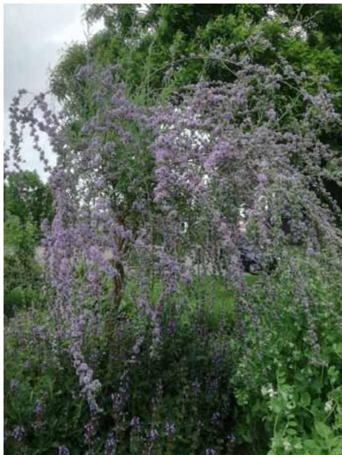
Bijzondere soort van de Vlinderboom